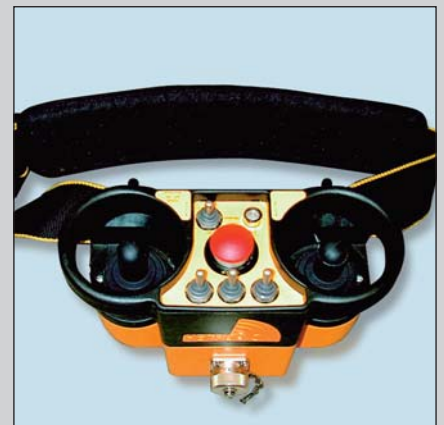
Die als Zubehör erhältliche Kombifernsteuerung Kabel/Funk ermöglicht einen Dauerbetrieb von ca. 100 Betriebsstunden. Im Bedarfsfall kann die Fernsteuerung direkt in der Maschine oder durch das Bedienen im Kabel-Modus geladen werden.