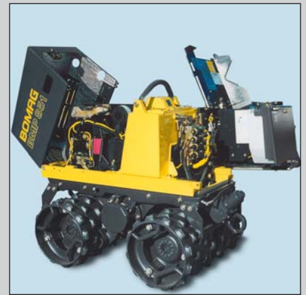
Reduzierte Betriebskosten durch gut zugängliche Service- und Wartungselemente.