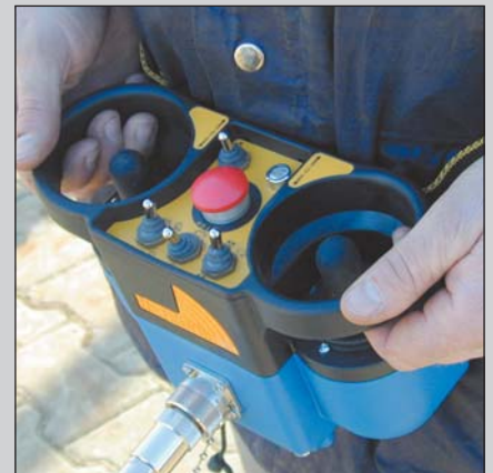
Abnehmbares Bedienpult mit Kabelfernsteuerung serienmäßig.