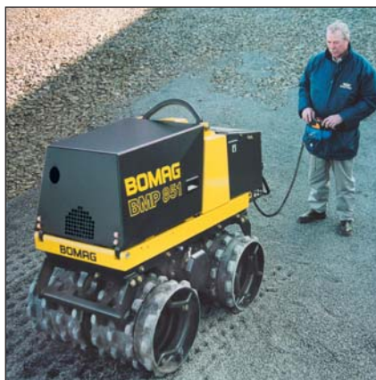
Der BMP 851 – serienmäßig mit Kabelfernsteuerung: hervorragend geeignet für großflächige Verdichtungsarbeiten.

Der Mehrzweckverdichter BMP 851 wurde speziell für Erdbauarbeiten entwickelt. Er eignet sich besonders zur Verdichtung bindiger Böden im Grabenbau, im Kanal- und Rohrleitungsbau, im Gleis- und Dammbau, für Bauwerkshinterfüllungen, im Deponiebau sowie für Unterbau- und Fundamentarbeiten. Die serienmäßige Kabelfernbedienung bietet optimale Voraussetzungen für Arbeiten in besonderen Gefahren- oder schwer zugänglichen Arbeitsbereichen.