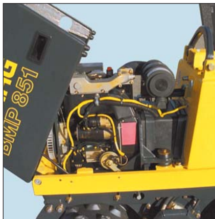
Hohe Kraftreserven, selbst unter extremen Bedingungen, bietet der drehmomentstarke 2-Zylinder Hatz Dieselmotor mit Ölmangelschaltautomatik.