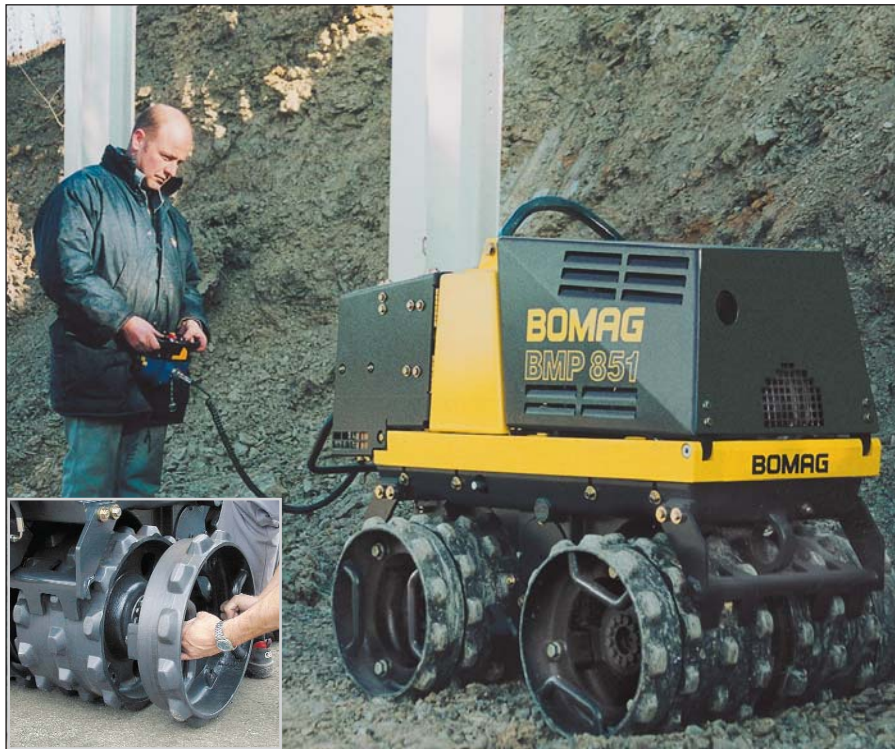
Eine Maschine – zwei Arbeitsbreiten: Das optional erhältliche Bandagenverbreiterungsset (610/850 mm) erlaubt das Anpassen der Arbeitsbreite innerhalb weniger Minuten.

Um den vielseitigen unterschiedlichen Anforderungen gerecht zu werden, wurde ein Großteil der geforderten Optionen als Standard in die Maschine aufgenommen. Der BMP 851 ist mit flexiblen Arbeitsbreiten und unterschiedlichen Stollenprofilen erhältlich. Ein