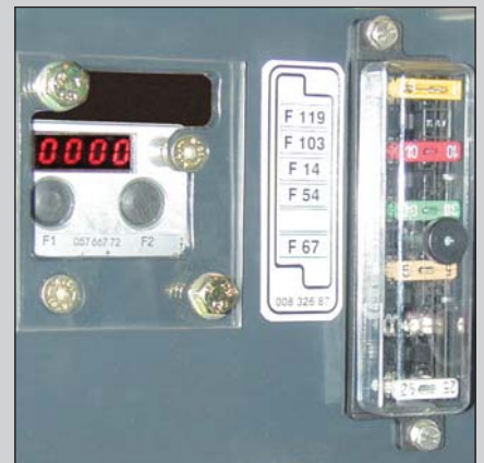
Servicefreundliches Diagnosemodul mit Fehlercodeanzeige, Betriebsstundenzähler und Batterietrennschalter unter der Abdeckhaube im Vorderrahmen.